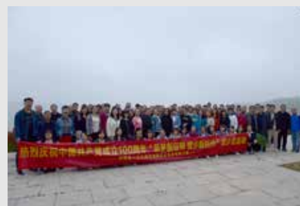
一三九公司开展健步走活动。