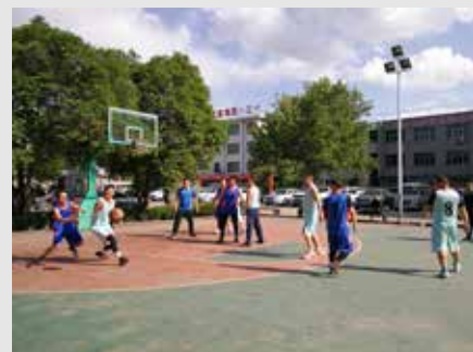
一三一公司举办“永远跟党走 奋进新时代”职工篮球赛。