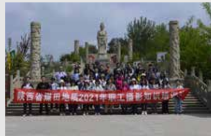
陕煤地质工会在职工教育培训基地——玉华宫举办了职工摄影知识培训班。